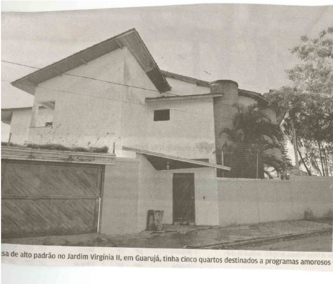
sa de alto padrão no Jardim Virgínia II, em Guarujá, tinha cinco quartos destinados a programas amorosos